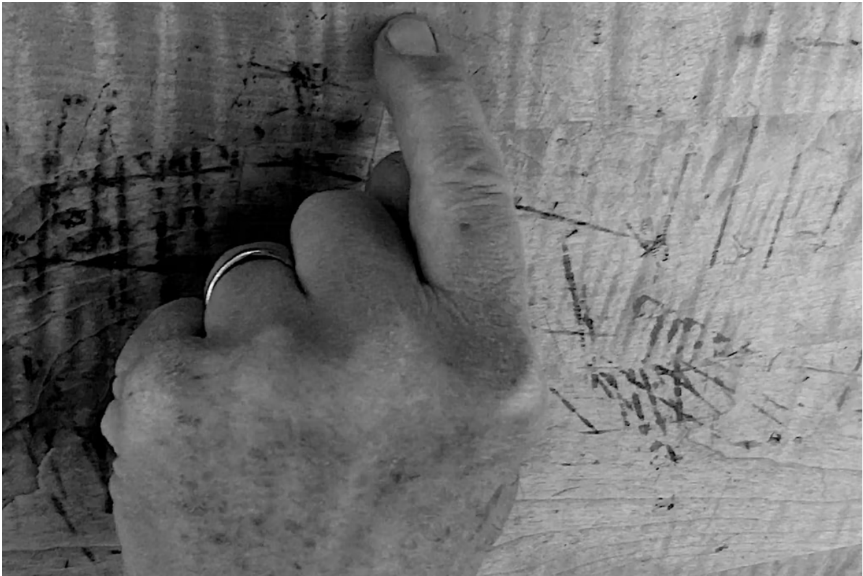
Bruce Nauman, die amerikanische Videolegende, mit der linken Hand auf Spurensuche im neuen Film „Practice“, in der Galerie Konrad Fischer