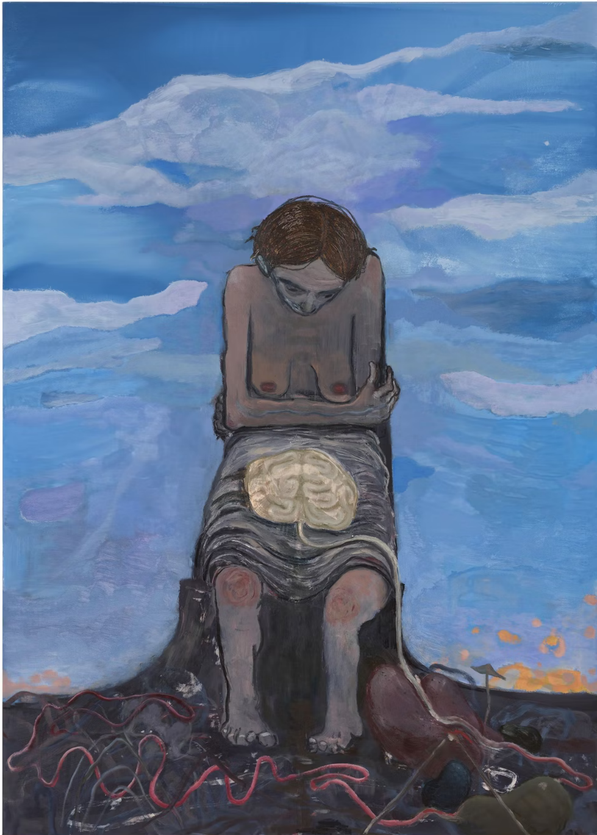
Sanya Kantarovsky „Return“, 2022, Galerie Capitain Petzel

Der Maler beschäftigt sich mit dem Tod, der ständigen Erinnerung an ihn, dem verletzbaren Körper. Putins Invasion, den Bruderkrieg seines Geburtslandes Russland gegen die Ukraine, bezeichnet er als „katastrophale Tragödie in Echtzeit“. Er sei Zeuge dieses verbrecherischen Brudermordes, der von einer Macht begangen werde, die ihre Verachtung fürs menschliche Leben zeige und den denkenden und fühlenden