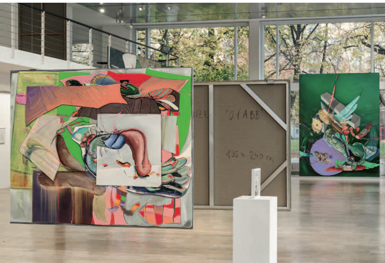
Installationsansicht, Stefanie Heinze, Dimensions of the Fool , Capitain Petzel, Berlin, 2022