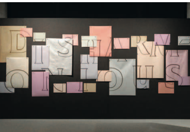
Raimond Boisjoly, Disharm-onious , 2022, Tintenstrahlendruck mit lösungsmittelhaltiger Farbe auf Vinyl, Foto: Michael Hauffen

Zur Ausstellung erscheint eine Publikation www.hkw.de