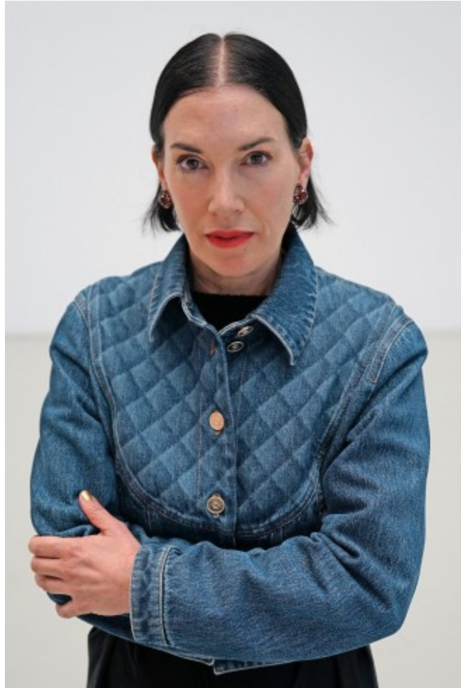
Sarah Morris

Wer sich als Künstlerin oder Künstler heute in ungegenständlichen Gefilden bewegt und, wie die 1967 in London geborene Sarah Morris, auf Hard-Edge-Malerei kapriziert, kann kaum anders, als ein ganzes Arsenal an Flashbacks auszulösen, denn über ein ganzes voriges Jahrhundert wurde da so ziemlich alles gemalt, was auf diesem Terrain erdenklich ist. Was das Œuvre der Amerikanerin besonders macht, sind die Rückkoppelungen zwischen ihren Glanzlackgemälden und ihren Filmen über Metropolen in aller Welt – Abu Dhabi, Beijing und Chicago, Los Angeles, Rio de Janeiro, Osaka und natürlich New York, wo sie 1998 an einem einzigen Tag ihren Erstling drehte. „Midtown“ feierte damals seine Premiere in der Kölner Ausstellung „I Love New York“.